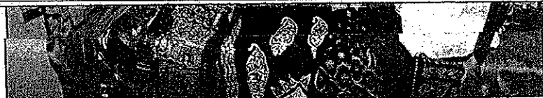
Exposição com produtos artesanais ajudam os indecisos quanto ao que presentear as mães

A mostra vai até sexta-feira, dia 10, e oferece opções de presentes para o Dia das Mães, que será neste domingo, dia 12.