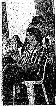
com promessa de

MAIS OPÇÕES - Outro lugar onde tem exposição