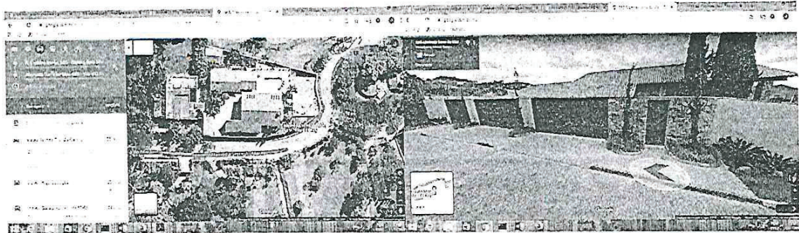
Residência declarada na JUCEMG: "Família Pena"